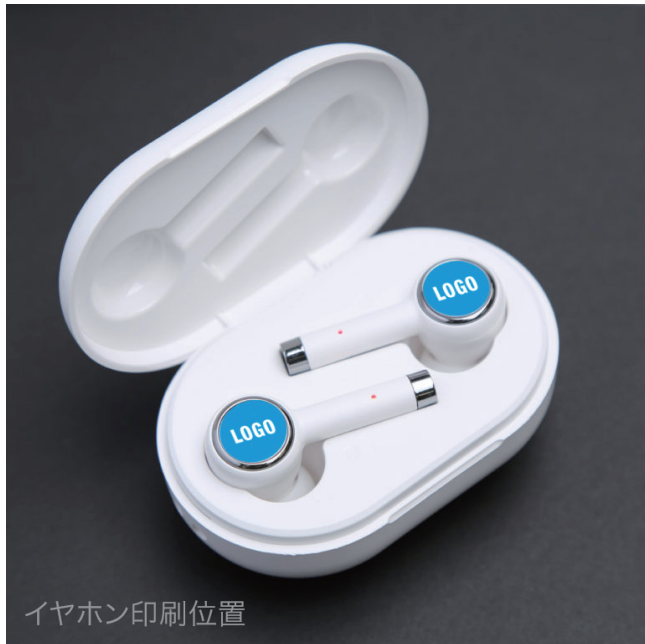
イヤホン印刷位置