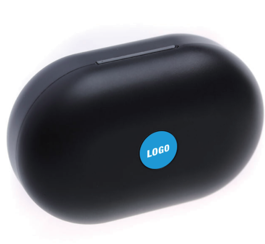
充電ケース印刷位置